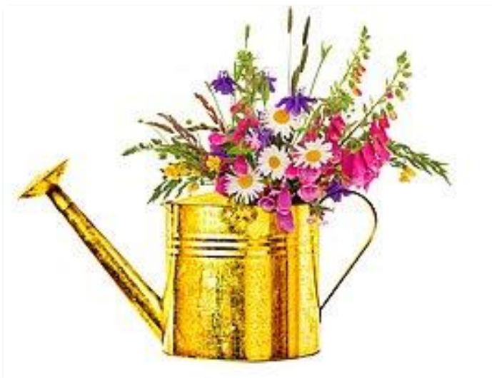
Die Stadt Iserlohn vergibt im Rahmen des Projektes Iserlohn blüht auf die Goldene Gießkanne für vorbildliche Gärten.