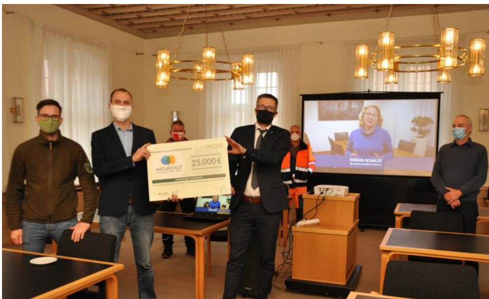
Fototermin zur Auszeichnungsverklebung im Wettbewerb Naturstadt am 25. November 2020 in der Hansestadt Havelberg.

Mehr Informationen rund um das Bündnis finden Sie unter www.kommbio.de