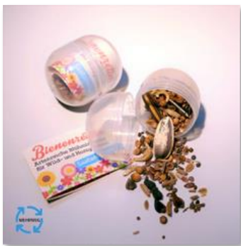
Samenmischung Lass deine Stadt aufblühen!

Die rapsgelben Bienenfutterautomaten werden immer beliebter. Die restaurierten Kaugummiautomaten geben für 50 Cent eine Saatgut-Kapsel aus. Die darin enthaltenen Samenmischungen bestehend u.a. aus Bauerngartenpflanzen, Kräutern und Wildstauden und sind dazu gedacht einen niederschweligen Zugang zur Natur zu ermöglichen und zu einem ersten Handeln auf dem Balkon, in Blumenkästen oder im eigenen Garten zu motivieren und zudem für das Thema des Insektensterbens zu sensibilisieren. Die beiden Samenmischungen Lass deine Stadt aufblühen (mehrjährig) und Bienenfreundin (ein- und zweijährig) helfen dabei die Nahrungsgrundlage zu verbessern und einen Gegensatz zur „Verschotterung“ mancher Gärten zu schaffen. Von Herbst bis zum Frosteintritt erhalten kleine und große Naturfreund*innen Zwiebeln von Krokussen, die als Frühblüher vor allem von Hummeln gebraucht werden. Die Bienenretter Manufaktur aus Frankfurt lässt in einer Integrationswerkstatt die Füllkapseln befüllen. Zu jedem Automaten gehört eine Sammelbox für die Mehrwegkapseln, welche durch die Bienenretter neu befüllt werden.