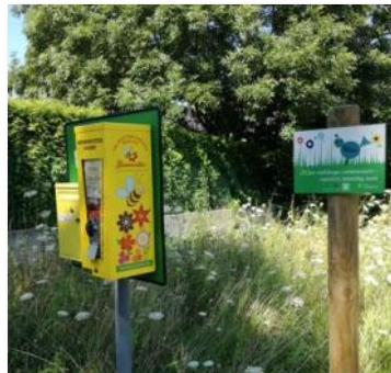
Der Bienenautomat in Geestland.