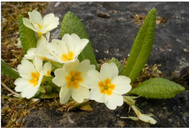
Alles Gute für das neue Jahr wünscht das Bündnis-Team.