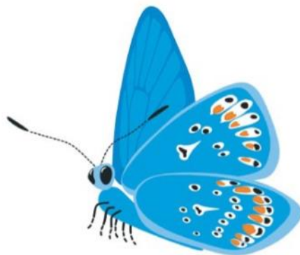
Haar's Umweltbotschafterin Luzy

Um der Bevölkerung die in der Gemeinde Haar umgesetzten Maßnahmen zur Förderung der biologischen Vielfalt näher zubringen, wurde die Bläulingsdame Luzy entwickelt. Alle Aktionen im Bereich Natur, Umwelt und Biodiversität werden seitdem mit der Umweltbotschafterin Luzy verknüpft, so dass sich der Wiedererkennungswert in der Bevölkerung erhöht. Beginnend mit dem Luzy-Malbuch für Kindertageseinrichtungen bis hin zu den Schautafeln des Gehölzlehrpfades und des Wildbienen-/Magerrasenlehrpfades .